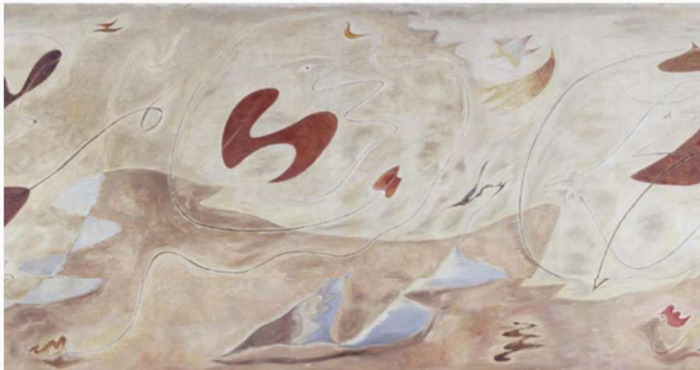
André Masson, La famille en métamorphose (Décoration murale) (La familia en metamorfosis [Decoración mural]), 1929