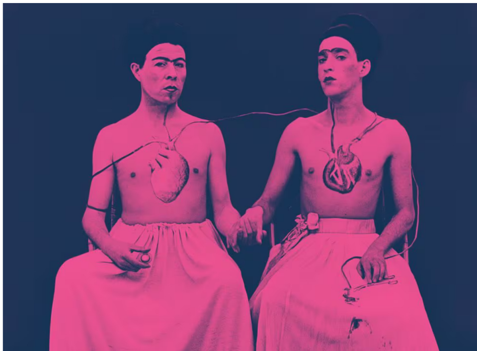
Imagen de la obra 'Las Dos Fridas. Las Yeguas del Apocalipsis', 1989.

Por ser suscriptor, te ofrecemos la oportunidad de conseguir una plaza para el curso Figuras de Artista. De la bohemia al estrellato , que tendrá lugar desde abril hasta junio. Un ciclo de conferencias organizado por la Fundación Amigos del Museo Reina Sofía , que recorrerá la historia del arte contemporáneo a través de algunos de los estereotipos con los que fueron señalados ciertos artistas. Participa para conseguir una de las 10 matrículas que sorteamos, valoradas en 195€.