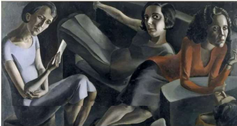
Tertulia, Ángeles Santos Portbou, Girona, España, 1911 - Madrid, España, 2013. Museo Reina Sofía

«Una imagen, una historia» a partir de imágenes de la colección del Museo Nacional Centro de Arte Reina Sofía.