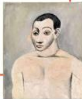
Pablo Picasso, Autoretrato, c. 1906. © Sucesión Picasso

Inscríbete en www.amigosmuseoreinasofia.org