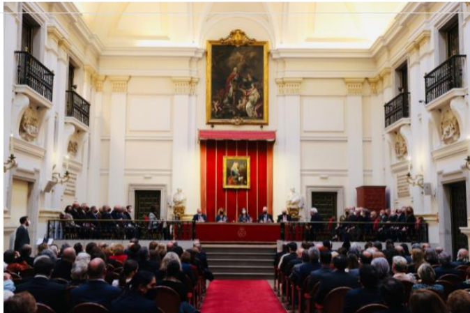
Vista general del salón de actos de la Real Academia de Bellas Artes de San Fernando