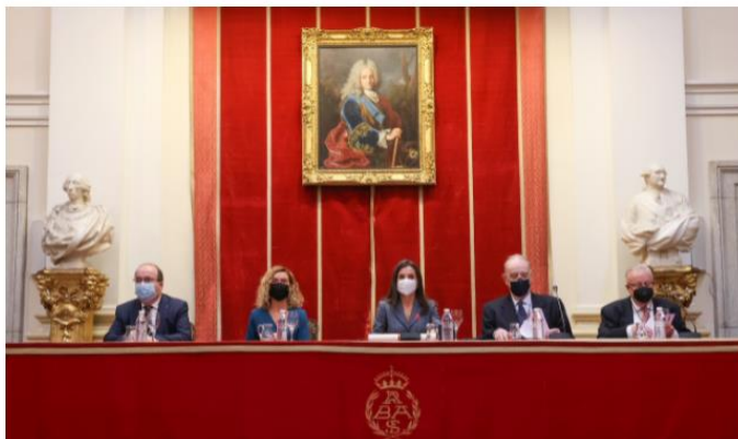
Doña Letizia junto a las autoridades en la mesa presidencial

La Medalla de Honor de la Academia se concede cada año a una persona o institución, española o extranjera, que se haya distinguido de modo sobresaliente en el estudio, promoción o difusión de las Artes, en la creación artística, en la protección del Patrimonio Histórico Natural y Cultural, o haya prestado extraordinarios servicios a la Corporación.