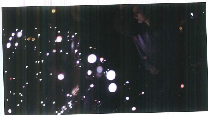
Instalación de Domestic Data Streamers "Lights of Wild" en California Academy of Sciences.