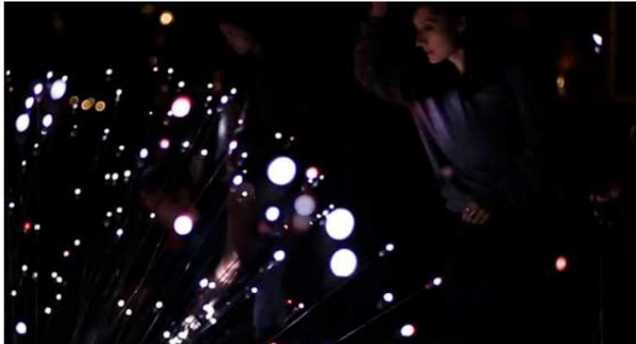
Curso Habitar los márgenes en el Reina sofía