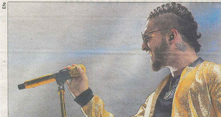
El colombiano llenó el antiguo Palacio de los Deportes